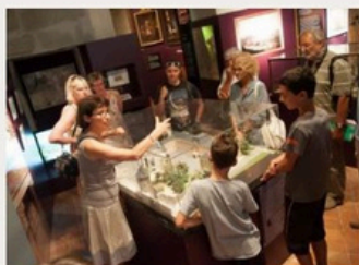
Château des Ducs de Savoie

Animations pour tous les âges, visites libres ou accompagnées par un médiateur, ressources et outils (fiches, livrets de jeux, carnets) pouvant être mis à disposition, partez à la recherche de l'offre qu'il vous faut !