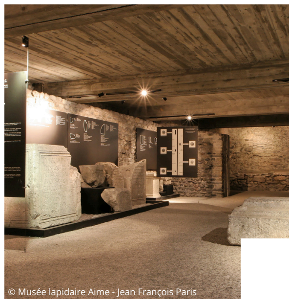
© Musée lapidaire Aime - Jean François Paris