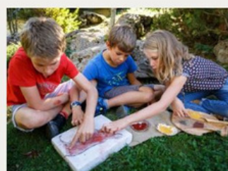
Musées de Savoie