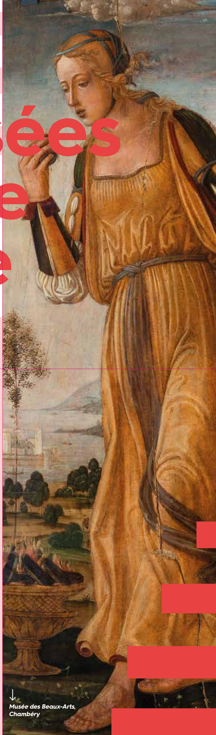
↓ Musée des Beaux-Arts, Chambéry