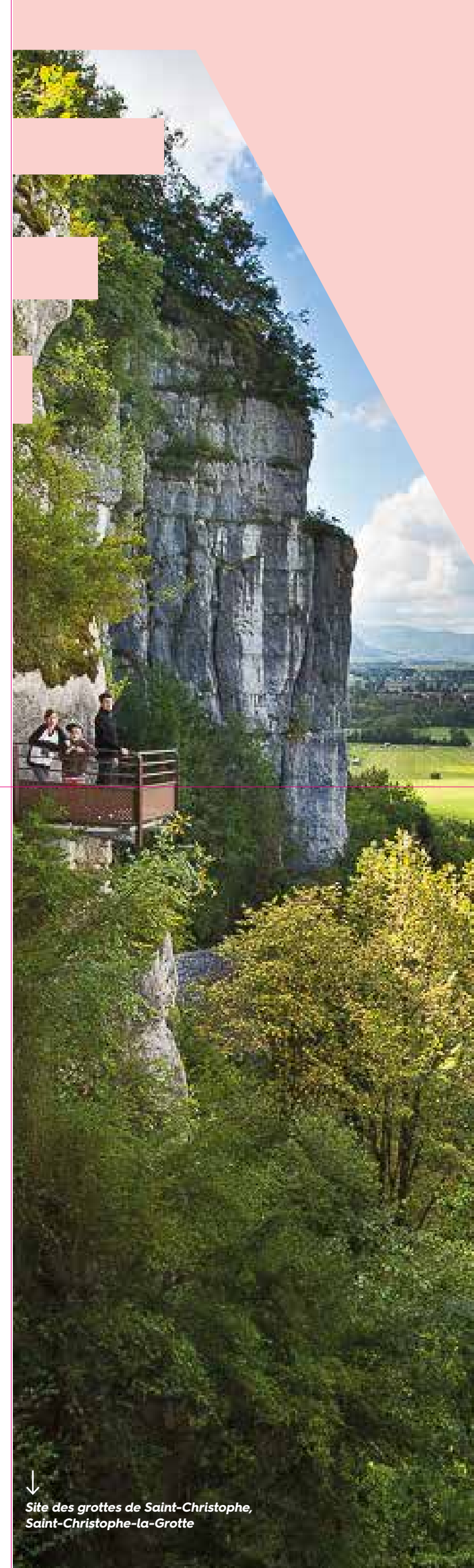
↓ Site des grottes de Saint-Christophe, Saint-Christophe-la-Grotte

* Merci de vérifier la liste des musées participant à chaque opération avant de vous déplacer.