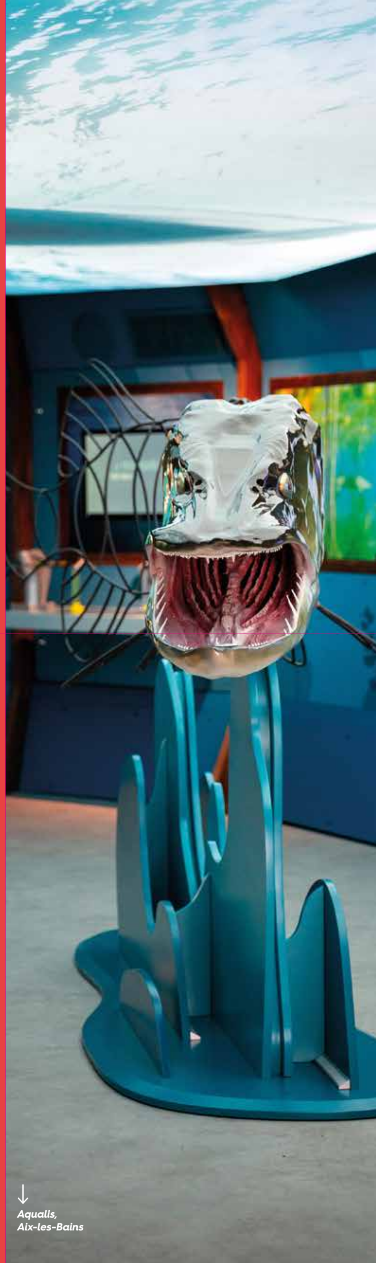
↓ Aqualis, Aix-les-Bains